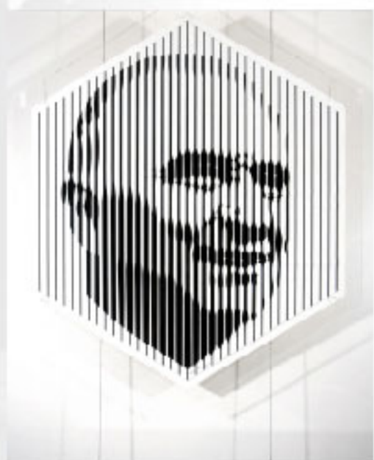
Portrait de Georges Pompidou, par Victor Vasarely (Musée Georges Pompidou, Montboudif).

Contact : Association cantalienne Georges Pompidou Hôtel du Département 35, rue Sorel - 15100 Saint-Flour. Tél. : 0471 60 21 80