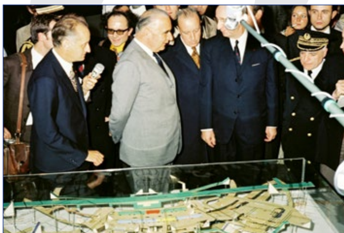
Inauguration de la gare RER d'Auber, 18 novembre 1971 © RATP, 79985