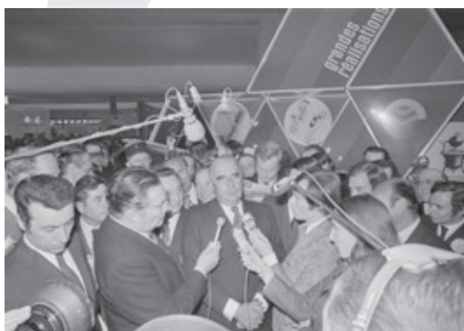
Salon de l'environnement, 2 juin 1972