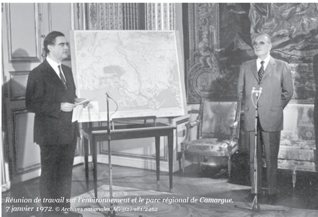
Réunion de travail sur l'environnement et le parc régional de Camargue, 7 janvier 1972. AG/5(2)/981/2462

(session présidée par Éric Bussière, président du Labex EHNE)